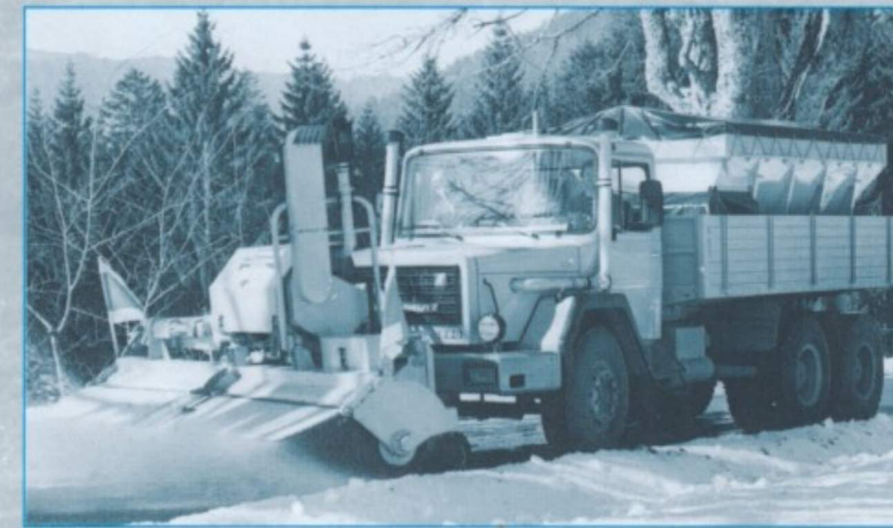
Blieb ein Versuch: Schneeräumkombination von Schmidt/Weisser auf dem 290 D 26 L 6x4-Fahrgestell.