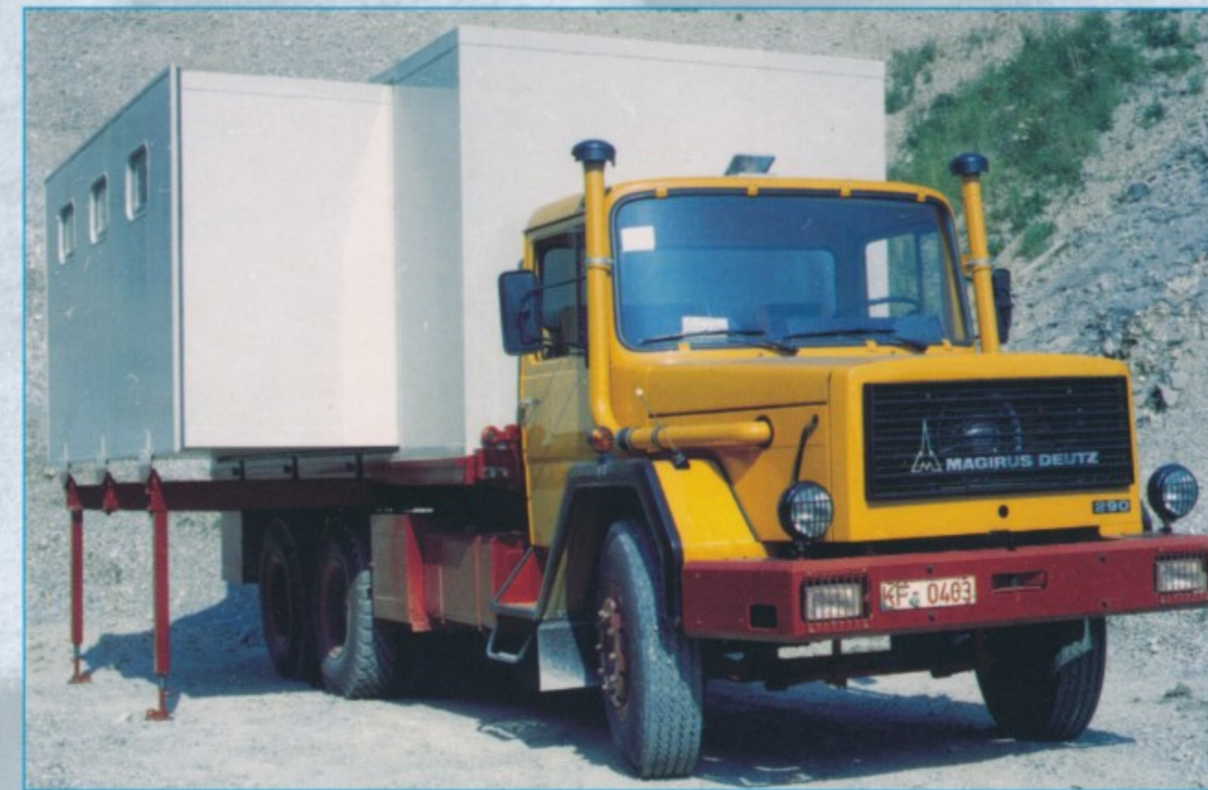
Werks-Kundendienst: Speziell ausgerüstet für die Reparatur der Magirus-Technik waren die ausziehbaren Werkstattaufbauten, die Rhein-Bayern lieferte.