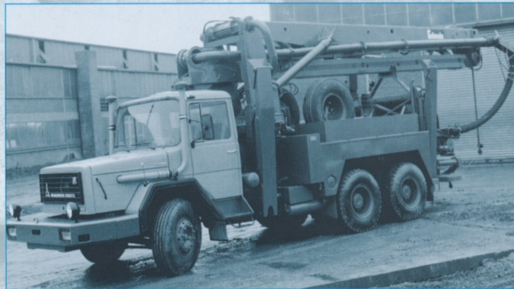
▲ Verlängerte Nase: Als Basis für die Betonpumpen der Firma Scheele diente ebenfalls das Kipperfahrgestell.