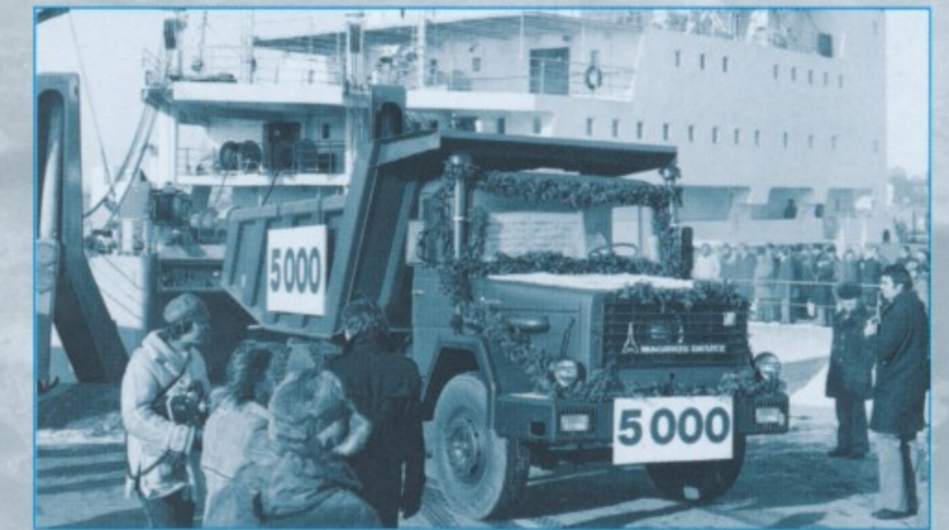
Halbzeit: Das 5000. gelieferte Fahrzeug wurde bei der Verladung in Hamburg gebührend gefeiert.