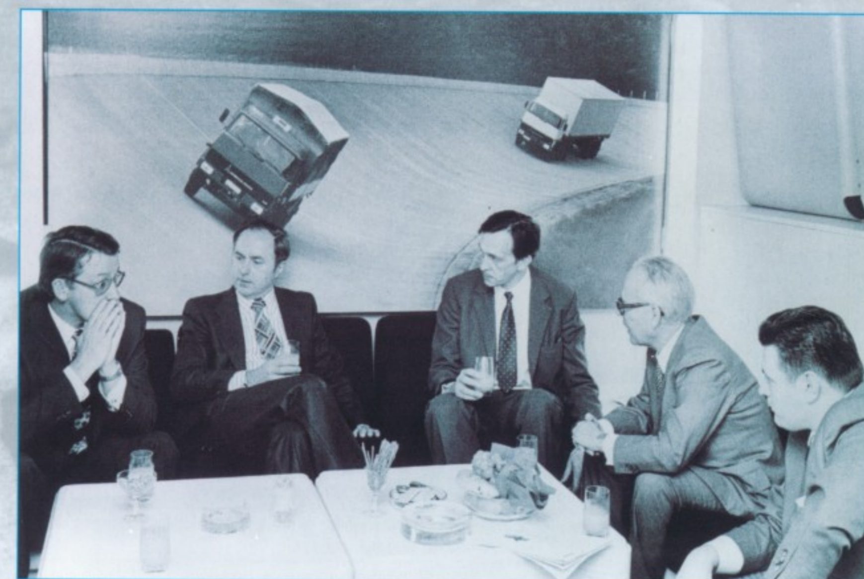
Auf hoher Ebene: Der sowjetische Botschafter Valentin Falin (Mitte) bei Gesprächen im Werk Donautal.

Schwäb'sche Eisenbahn: Auf Ganzzügen der Deutschen Bundesbahn reisten die Haubenfahrzeuge von Ulm zum Hamburger Hafen.