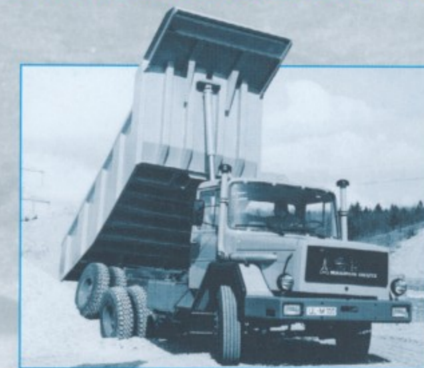
◀ Zusatzscheinwerfer auf der Stoßstange und ein hochgelegter Ansaugtrakt kennzeichneten die endgültige Ausführung der Hauber.

Aber der Großauftrag sorgte nicht überall für zufriedene Gesichter: Durch die Überbelastung der Produktionsanlagen führten Lieferzeitüberschreitungen bei Stammkunden zu erheblichem Ärger, und auch manch anderer lukrativer Auftrag konnte aus Kapazitätsgründen nicht realisiert werden. Das Bauvorhaben der Baikal-Amur-Magistrale stellte extreme Anforderungen an Menschen und Maschinen unter hierzulande nicht bekannten Bedingungen. Temperaturen von bis zu minus 60°C im Winter und bis zu plus 40°C im kurzen Sommer mussten die Magirus-Lastwagen mit ihren bewährten luftgekühlten KHD-Motoren möglichst klaglos verkraften. Die auf 10 bzw. 15 Tonnen Nutzlast ausgelegten Muldenkipper wurden, je nach Art des Transportgutes, permanent um bis zu 50 Prozent überladen. Befestigte Straßen waren nahezu unbekannt, provisorische Schlamm- u. Schotterpisten stellten höchste Anforderungen an die lediglich hinterachsgetriebenen Magirus-Fahrzeuge. Keines der gelieferten Fahrzeuge war mit Allradantrieb ausgerüstet – aus heutiger Sicht eigentlich unerklärlich!