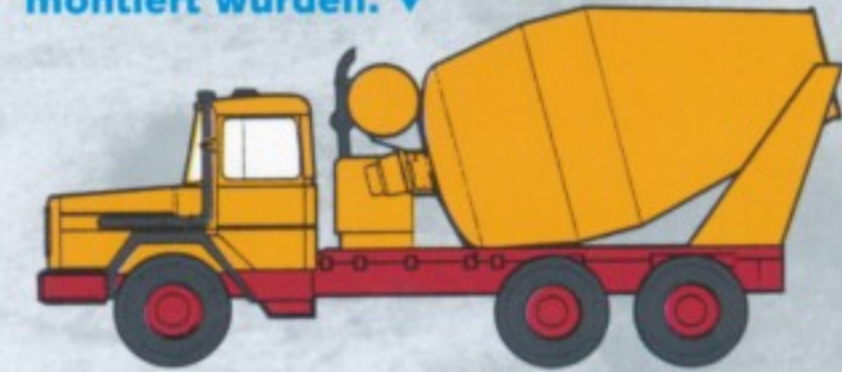
Vögele lieferte zahlreiche Mischaufbauten mit 6,5 m 3 Fassungsvermögen, die auf das M 290 D 26 K-Fahrgestell montiert wurden. ▼