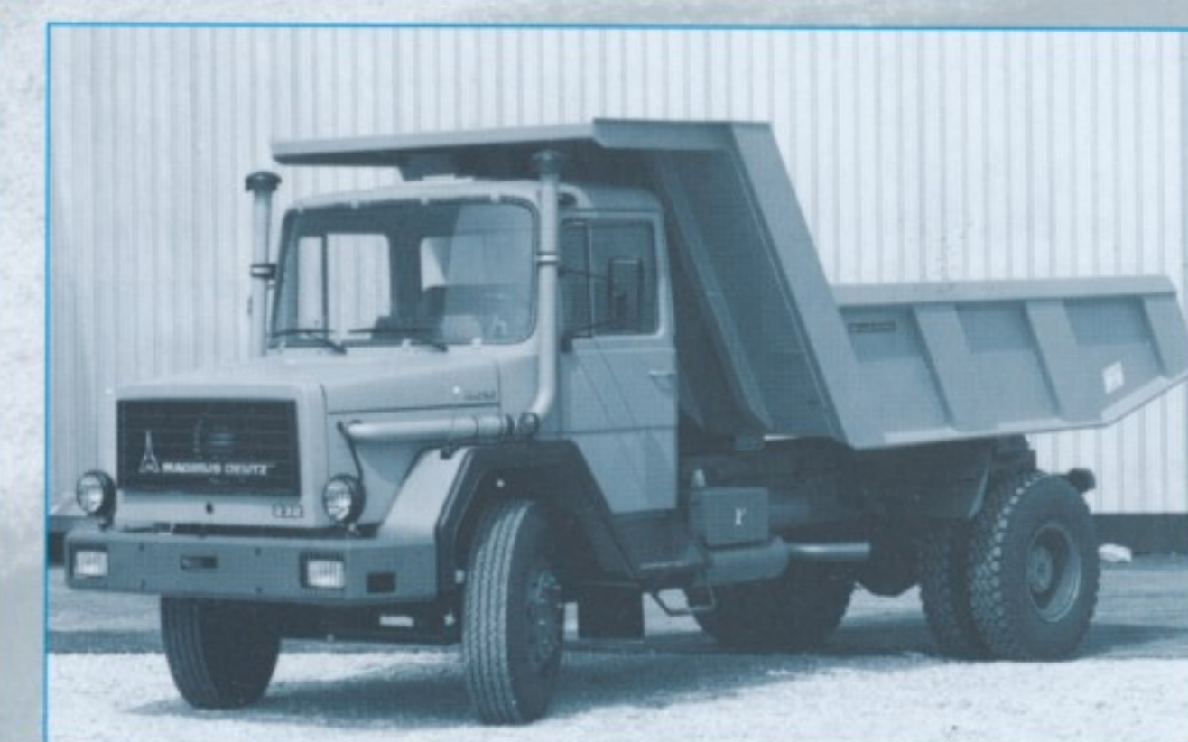
Für den Tunnelbau: Der zweiachsige M 232 D 19 K 4x2 gehörte sowohl mit beheizbarer Flachmulde als auch mit Gesteinsmulde ohne Heckklappe zum Lieferumfang.