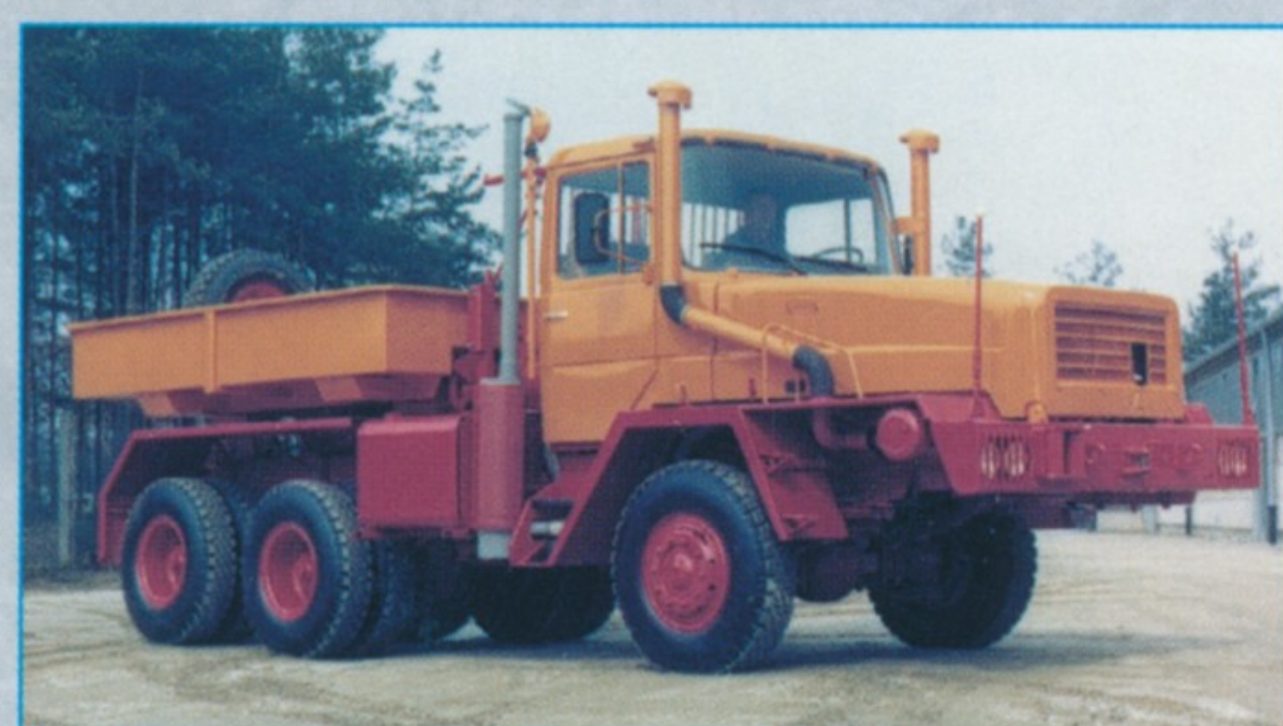
Ein Teil der 60 Faun-Zugmaschinen war mit einer Ballastbrücke ausgerüstet.