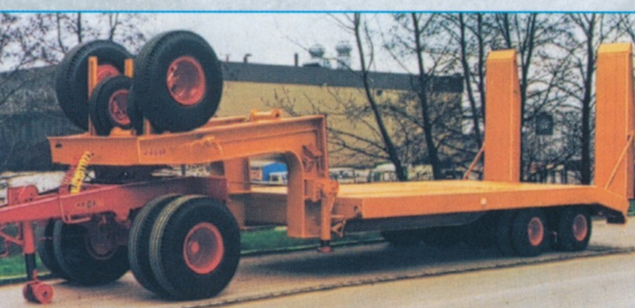
Mitgelieferte Dolly-Achsen ermöglichten eine universelle Nutzung der Kögel-Auflieger.

Bei der 8-Kubikmeter-Ausführung verhinderte eine in die Muldenwände installierte Abgasheizung ein Festfrieren des Transportgutes. In größerer Stückzahl wurden die Typen M 232 D19 L (4x2) und M 290 D26 L (6x4) mit besonders stabilen Pritschen von Kögel ausgerüstet. Lediglich bei den Brücken für die Zweiachser wurde der Fahrzeugbauer Köpf aus Schemmerberg nach Konstruktionsvorgaben von Kögel mit eingeschaltet. Als Einzelstück lieferte die Memminger Firma Klaus einen „Kranmobil-Auflieger“ mit drei gelenkten Achsen für das selbsttätige Be- u. Entladen von Rohrleitungen. Als Sattelzugmaschine diente der Typ M 290 D26 S (6x4). Ebenfalls Einzelstücke waren zwei zur Erprobung gelieferte Winterdienst-Fahrzeuge des Typs M 290 D26 L (6x4), welche mit Schneeräumgeräten von Schmidt und Streugeräten von Weisser dem sibirischen Winter trotzen sollten, was aber offenbar ohne großen Erfolg blieb, denn zu einer Beschaffung kam es nicht. Für die mobilen Betonwerke am Rande der BAM wurden 6,5 Kubikmeter fassende Transportbetonmischer des Typs VTM 651 S der Firma Vögele zur Belieferung der zahlreichen Bauwerke eingesetzt. Das Einbringen des Betons übernahmen Auto-Betonpumpen mit hydraulischen Verteilermasten, die von der Firma Scheele geliefert wurden und pro Stunde rund 60 Kubikmeter Beton bei einer Reichweite von 29 Metern befördern konnten. Als Fahrgestelle für die Mischer und Pumpen fanden die Typen M 290 D26 K (6x4) Verwen-