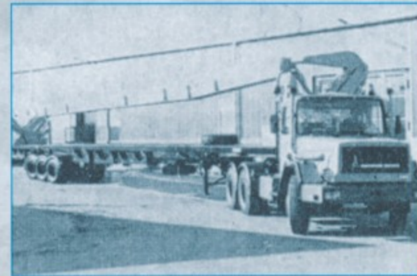
▲ Einzelstück: M 290 D 26 S 6x4 mit Klaus 'Kranmobil'-Auflieger.