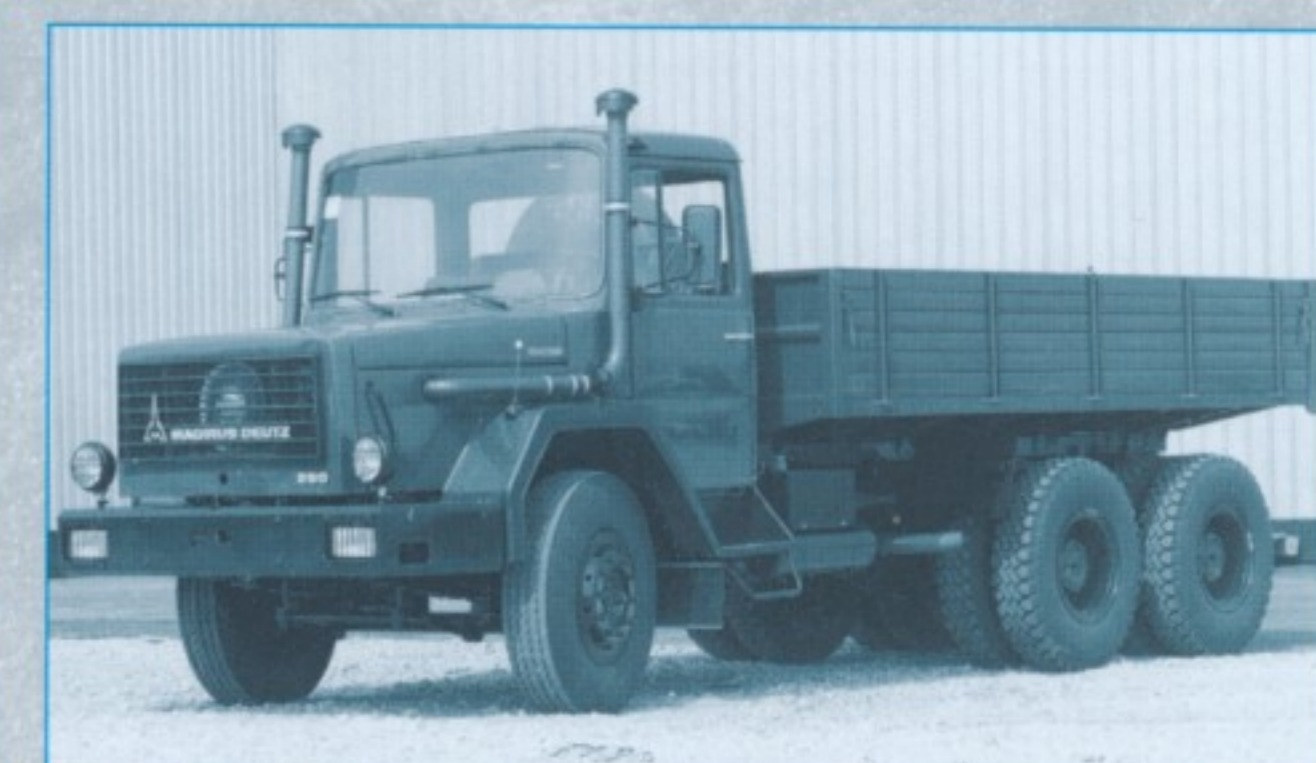
Kögel in Ulm lieferte hochbelastbare Pritschen mit Holzbordwänden, die bei den Zweiachsern 12 und bei den Dreiaxsern 16,6 Tonnen Nutzlast ermöglichten.