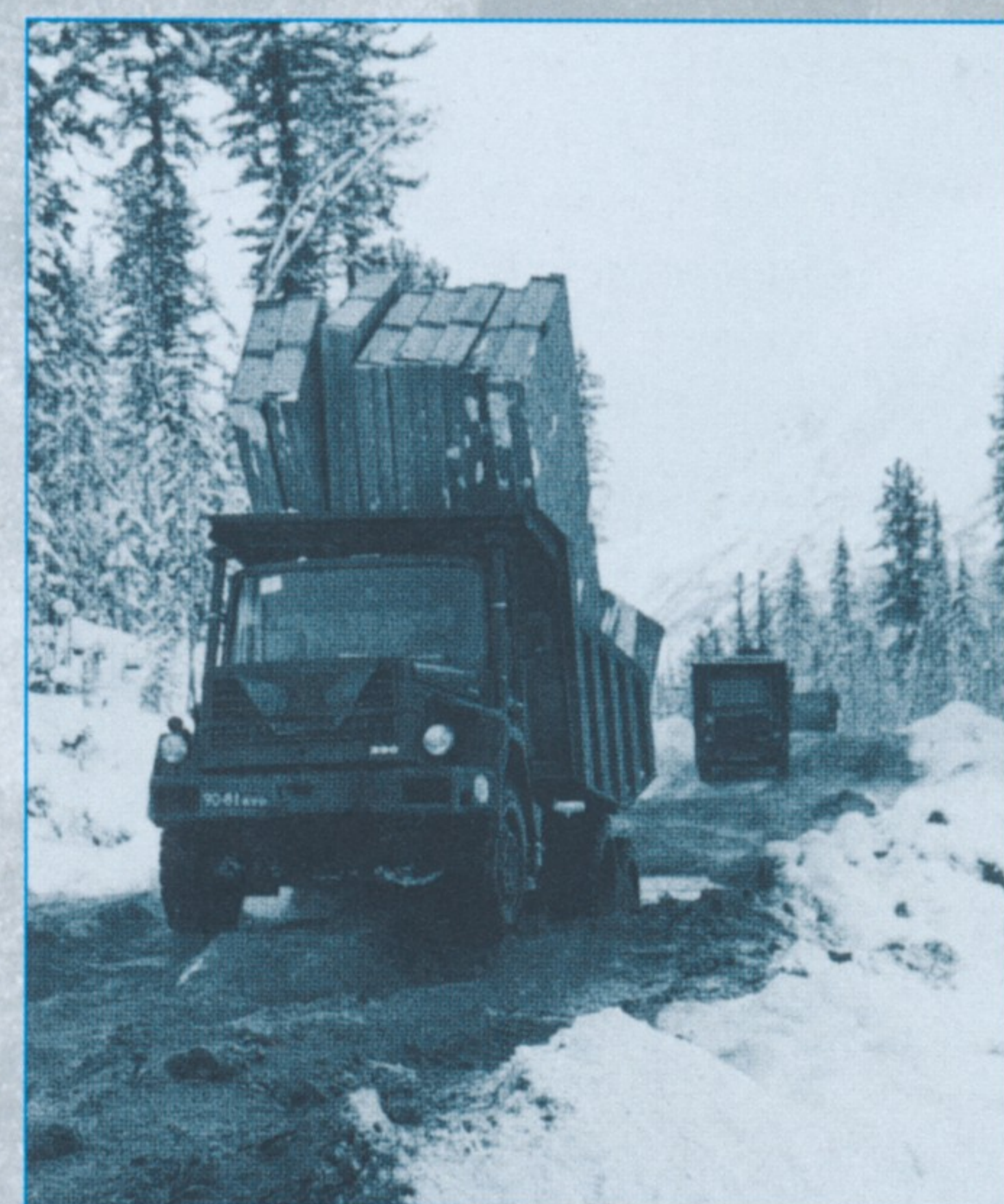
Gute Pflege, robuste Technik: Trotz härtester Beanspruchung wurden Mitte der achtziger Jahre noch rund 9000 „Bullen“ in Sibirien eingesetzt.

Leider so gut wie gar nichts lesen konnte man damals über die Vielfalt der Aufbauarten und die hervorragenden Produkte der zahlreichen Unterlieferanten, welche ebenfalls den extremen Belastungen der sibirischen Verhältnisse ausgesetzt waren. Hier schließt die vorliegende Dokumentation sicherlich eine bestehende Lücke. Über die näheren Begleitumstände des seinerzeitigen „Milliarden-Geschäftes“ gibt zudem das 1989 im Econ-Verlag erschienene Buch „Der Zukunft ein Stück voraus – 125 Jahre Magirus“ Auskunft, das interessierte Leser ausschließlich antiquarisch über den Oldtimer Club Magirus (OCM) in Ulm beziehen können. bb