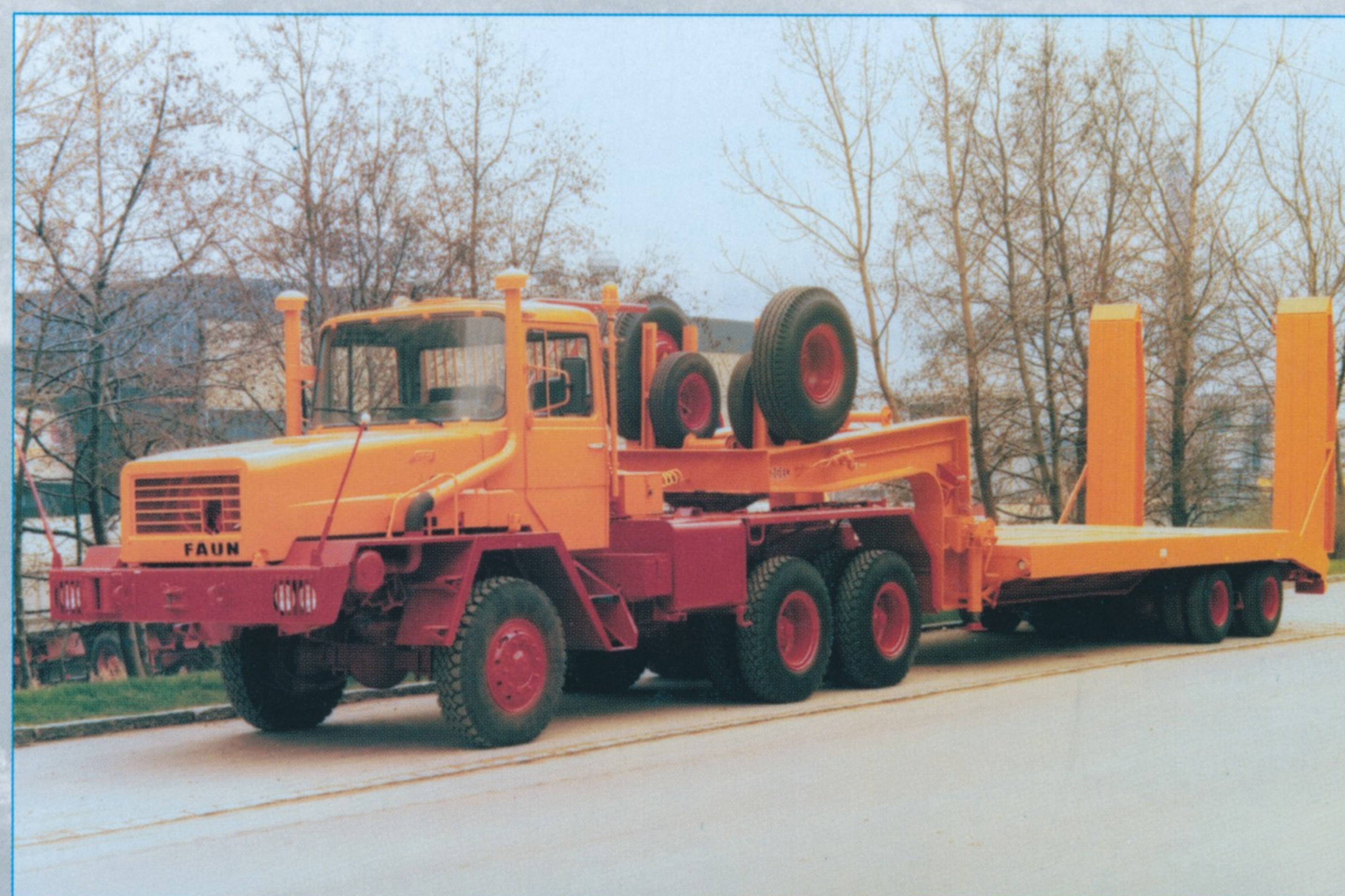
Kein Magirus, aber ähnlich: Faun HZ 34.30/41 6x6 mit Kögel-Satteltiefelader ST 56-90 für 60 Tonnen Nutzlast.

Bei der 8-Kubikmeter-Ausführung verhinderte eine in die Muldenwände installierte Abgasheizung ein Festfrieren des Transportgutes. In größerer Stückzahl wurden die Typen M 232 D19 L (4x2) und M 290 D26 L (6x4) mit besonders stabilen Pritschen von Kögel ausgerüstet. Lediglich bei den Brücken für die Zweiachser wurde der Fahrzeugbauer Köpf aus Schemmerberg nach Konstruktionsvorgaben von Kögel mit eingeschaltet. Als Einzelstück lieferte die Memminger Firma Klaus einen „Kranmobil-Auflieger“ mit drei gelenkten Achsen für das selbsttätige Be- u. Entladen von Rohrleitungen. Als Sattelzugmaschine diente der Typ M 290 D26 S (6x4). Ebenfalls Einzelstücke waren zwei zur Erprobung gelieferte Winterdienst-Fahrzeuge des Typs M 290 D26 L (6x4), welche mit Schneeräumgeräten von Schmidt und Streugeräten von Weisser dem sibirischen Winter trotzen sollten, was aber offenbar ohne großen Erfolg blieb, denn zu einer Beschaffung kam es nicht. Für die mobilen Betonwerke am Rande der BAM wurden 6,5 Kubikmeter fassende Transportbetonmischer des Typs VTM 651 S der Firma Vögele zur Belieferung der zahlreichen Bauwerke eingesetzt. Das Einbringen des Betons übernahmen Auto-Betonpumpen mit hydraulischen Verteilermasten, die von der Firma Scheele geliefert wurden und pro Stunde rund 60 Kubikmeter Beton bei einer Reichweite von 29 Metern befördern konnten. Als Fahrgestelle für die Mischer und Pumpen fanden die Typen M 290 D26 K (6x4) Verwen-